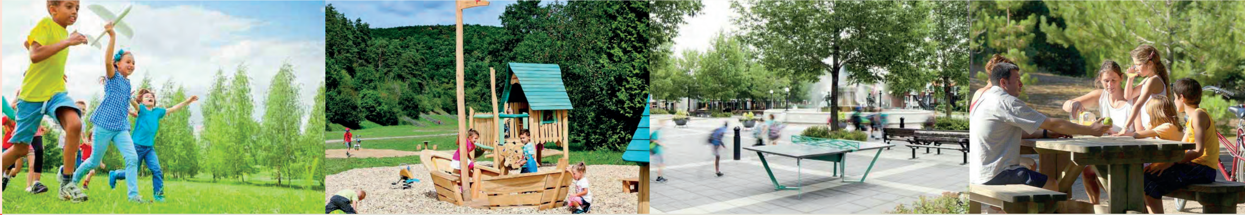
Images d'inspiration Inspirational pictures

Le projet proposé vise la construction d'un bâtiment multirésidentiel locatif de neuf étages comprenant 272 unités, des espaces communs à l'usage de l'immeuble, ainsi que deux étages de stationnement souterrain offrant un total de 390 cases. De ce nombre, 24 cases seront munies d'une borne électrique et 11 cases seront réservées pour les véhicules en autopartage.